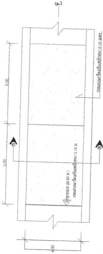
แปลนฐานคอนกรีตเสริมเหล็ก