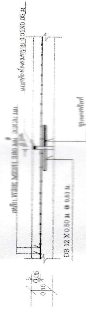
แบบขยาย ขอบคานาครีตเสริมเหล็ก (EXPANSION JOINT)